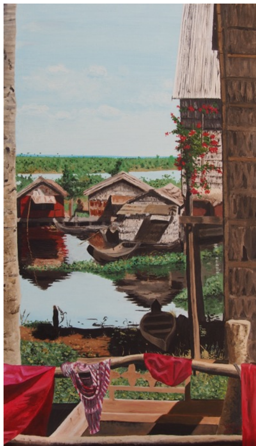
ILLUSTRATIONS: PEINTURES À L'HUILE DE VÉRA PASCHE Tous droits réservés